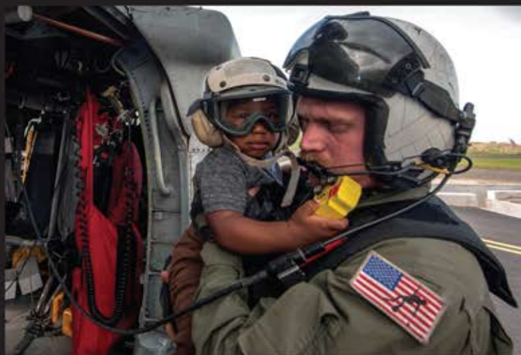
■ سرباز نیروی دریایی هوایی در حال حمل طفل نجات یافته پس از طوفان «ماریا» در جزیره دومینیکا