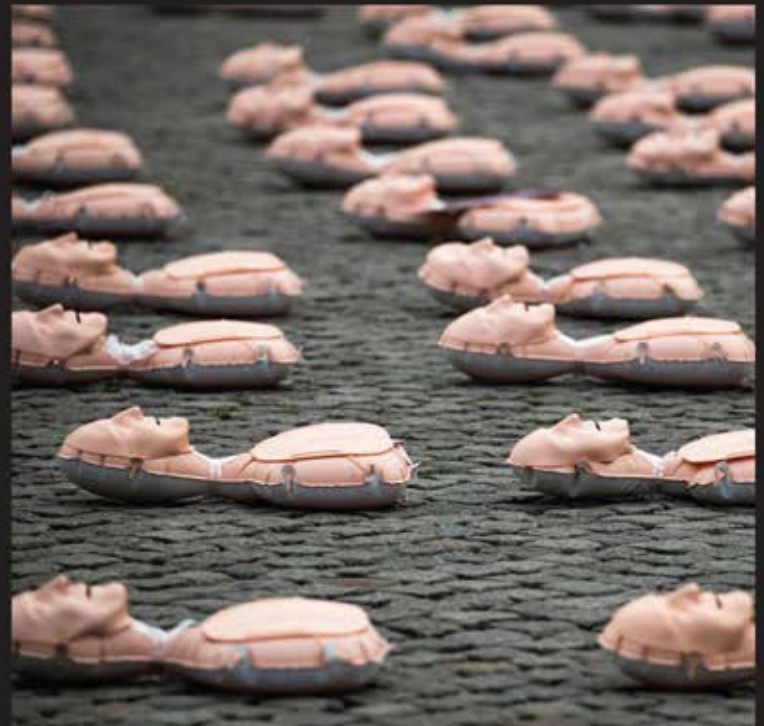
■ مانکن های احیاء در رقابت امداد و احیاء دانشکده پزشکی گریفسوآلد کشور آلمان