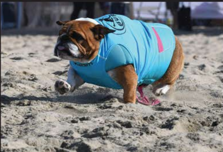
سگ های گشت در مسابقه «Surf City Surf Dog» در ساحل هانتینگتون کالیفرنیا