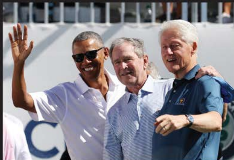
■ اوباما، بوش و کلینتون ۳ رئیس جمهور اسبق ایالات امریکا در پرزیدنتس کاپ مسابقه گلف بازان آمریکایی