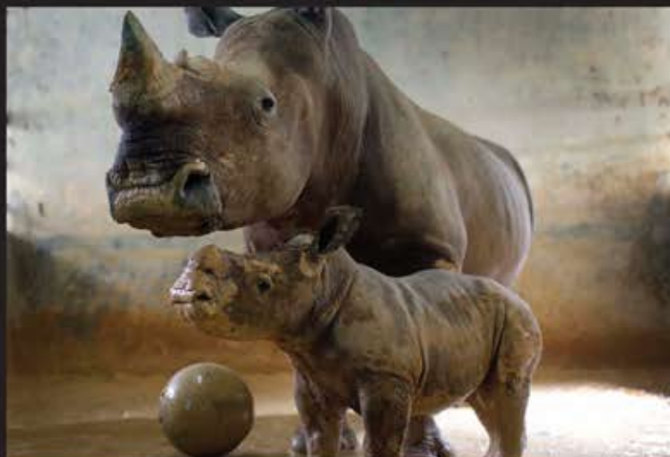
■ مراسمی که هر سال مردم روستایی در اسپانیا با به دست گرفتن مشعل و فانوس در روز بازگشت بقایای کشیش کاتولیک سانتو توریسیو به زادگاهش بر پا می کنند