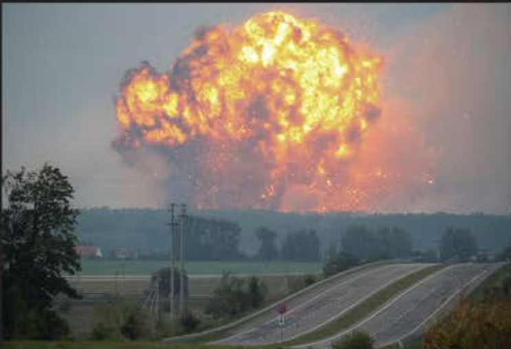
انفجار انبار مهمات پایگاه ارتشی در شهر «Kalynivka» در اوکراین