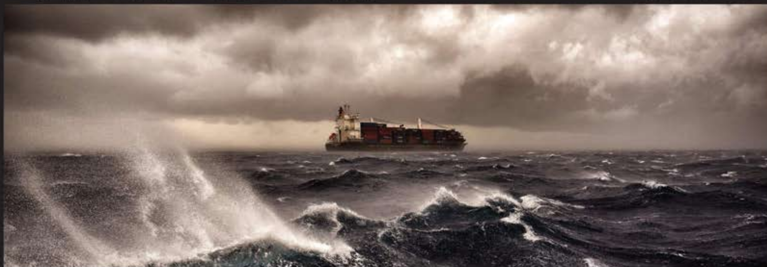
■ کشتی باری در دریای مدیترانه در طوفان در ۲۰ مایلی مالتا