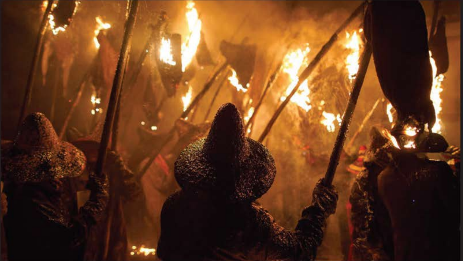
■ انفجار اتبار مهمات پایگاه ارتشی در شهر «Kalynivka» در اوکراین