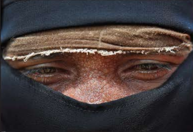
پناهنده روهینگیا در انتظار دریافت کمک در بازار کاکس بنگلادش