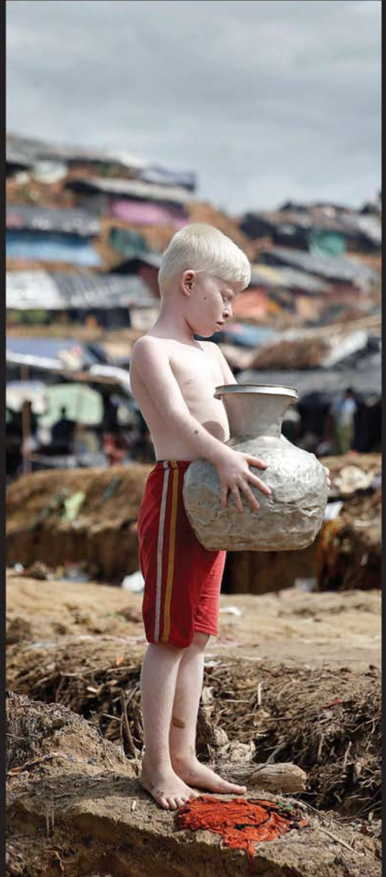
پناهنده آلبینو در بازار کاکس بنگلادش