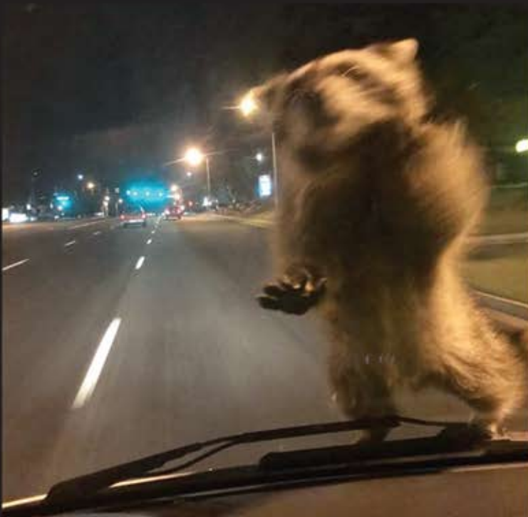
■ این عکس توسط نیروی پلیس کلرادو اسپرینگز گرفته شده هست زمانی که ماموریت بررسی یک صحنه تصادف را داشته هست