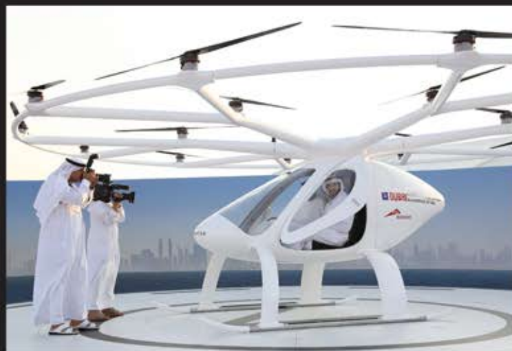
■ حمدان بن محمد بن راشد پرنس شهر دبی در تاکسی هوایی در شهر دبی که اولین تاکسی پروازی بدون سرنشین در دنیاست